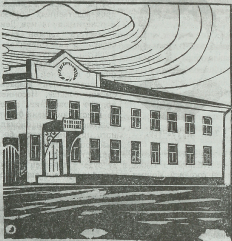
Здание Редакции газ. „Бур.-Монг. Правда“