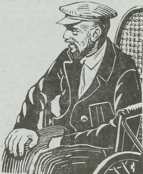
В. И. Ленин выздоравливает. Новейший снимок Владимира Ильича, произведенный в августе 1923 г.