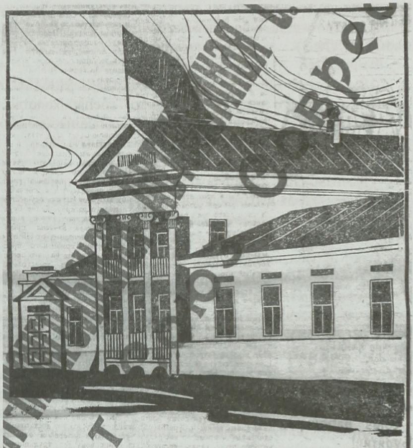
В.-Удиково Здание, в котором помещаются Центр. Исл. Комит. и Сов. Нар. Ком. ВМАССР.