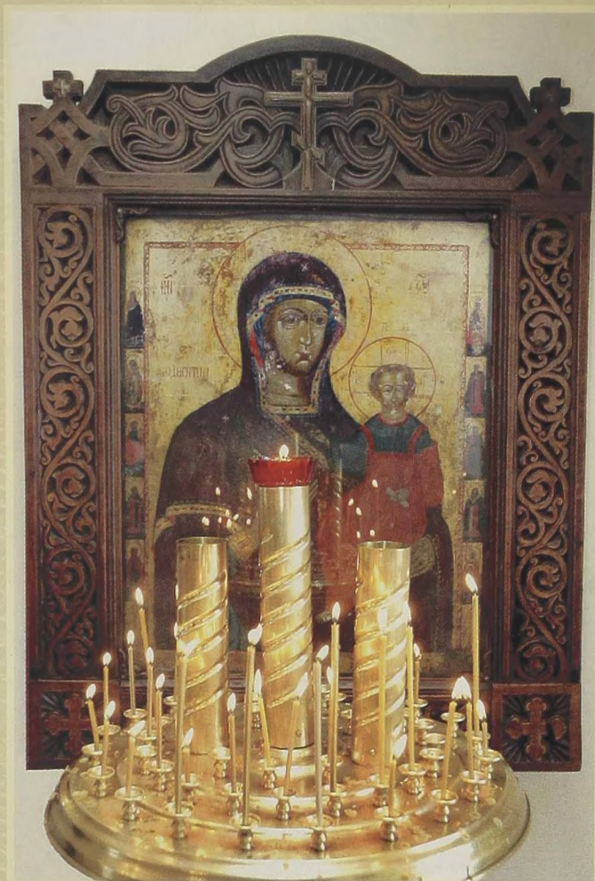
Икона Божией Матери "Одигитрия"

28-30 августа 2004 г. в стенах Свято-Одигитриевского собора находились мощи преподобномучениц Великой княгини Елисаветы и инокини Варвары, прибывшие из Иерусалима и путешествовавшие по всей России. А 2 мая 2005 г. православные города встречали в храме Благодатный Огонь из Иерусалима.