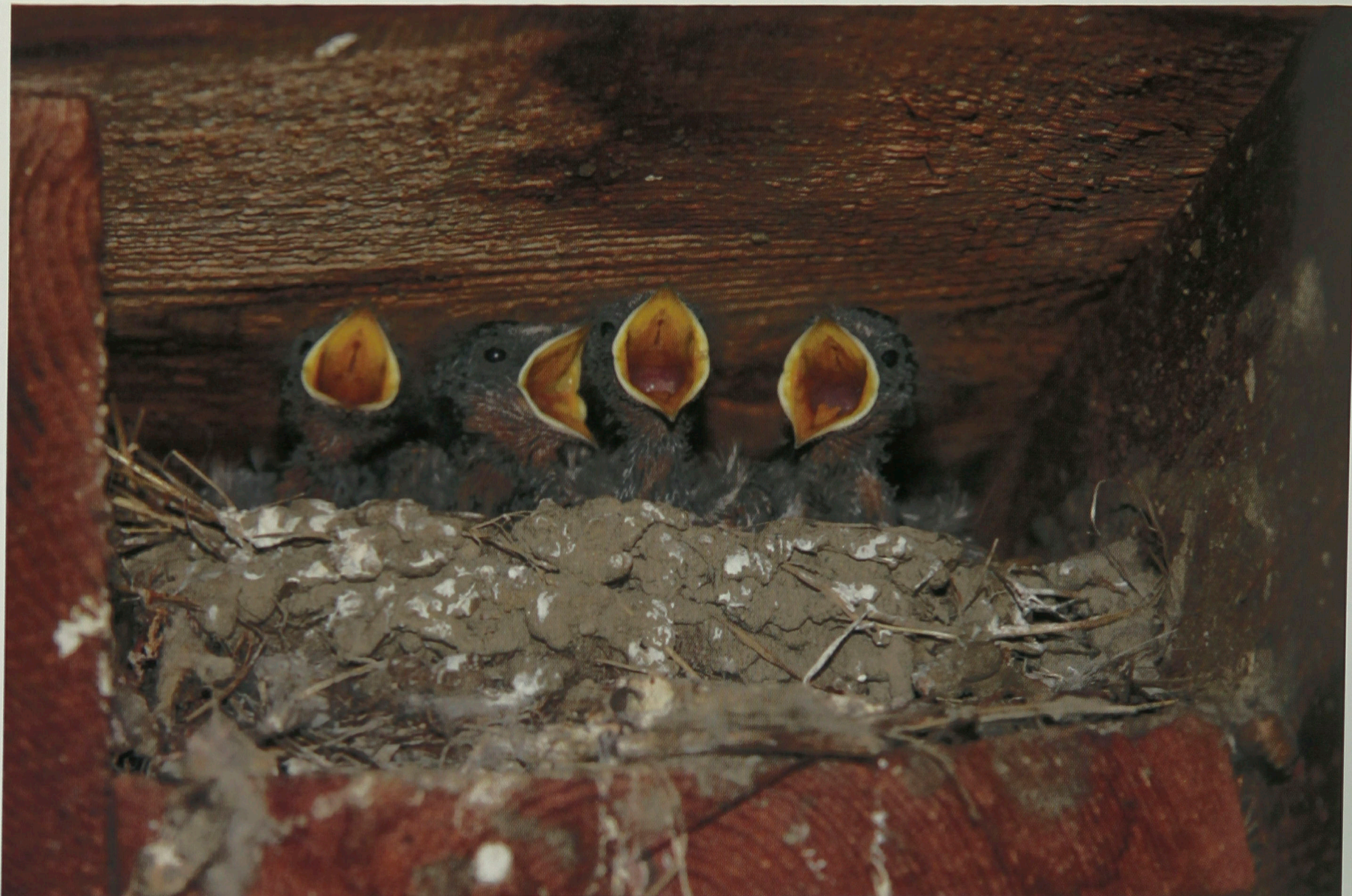
Птенцы деревенской ласточки