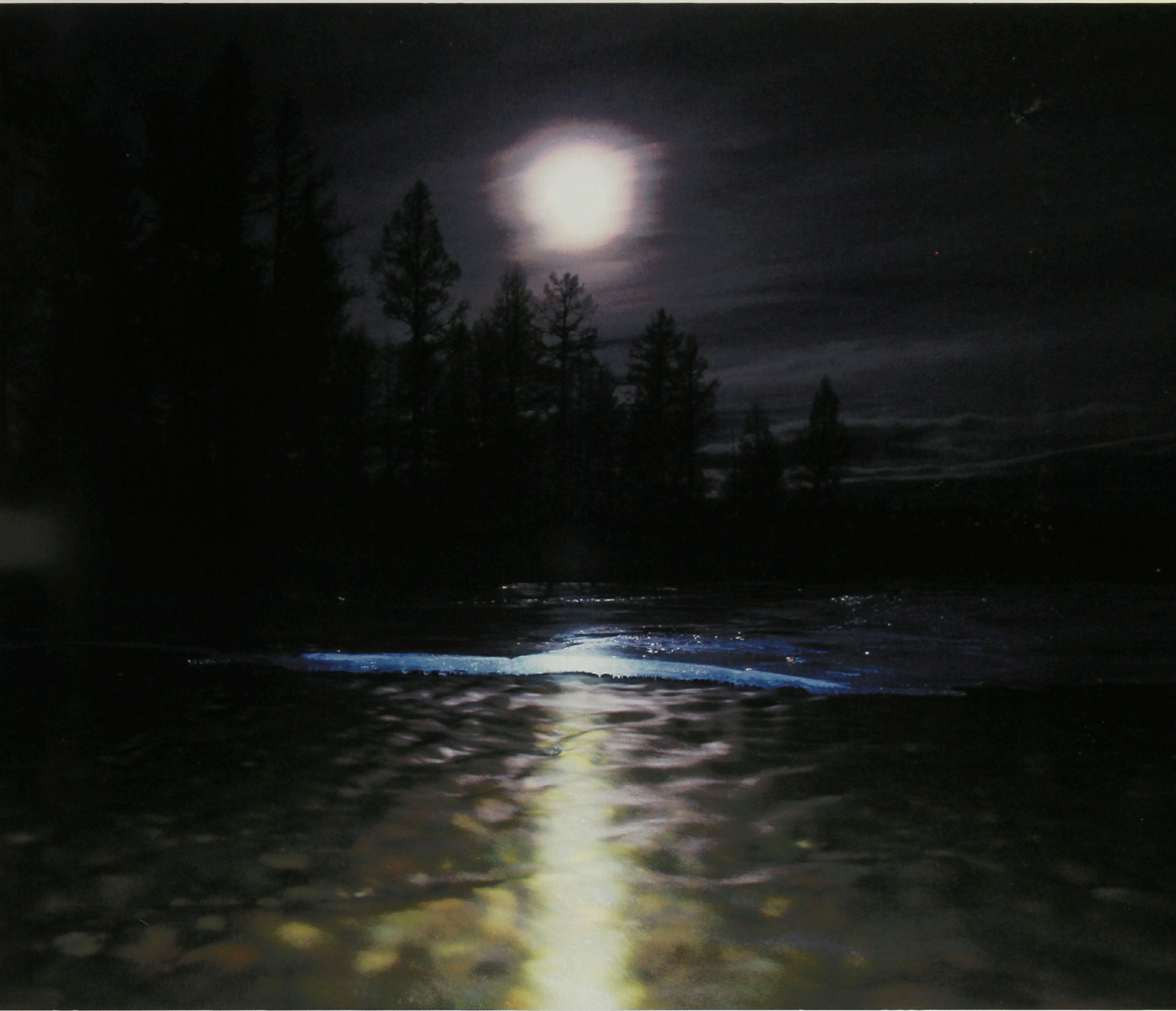
Лунная дорожка, река Багдаринка