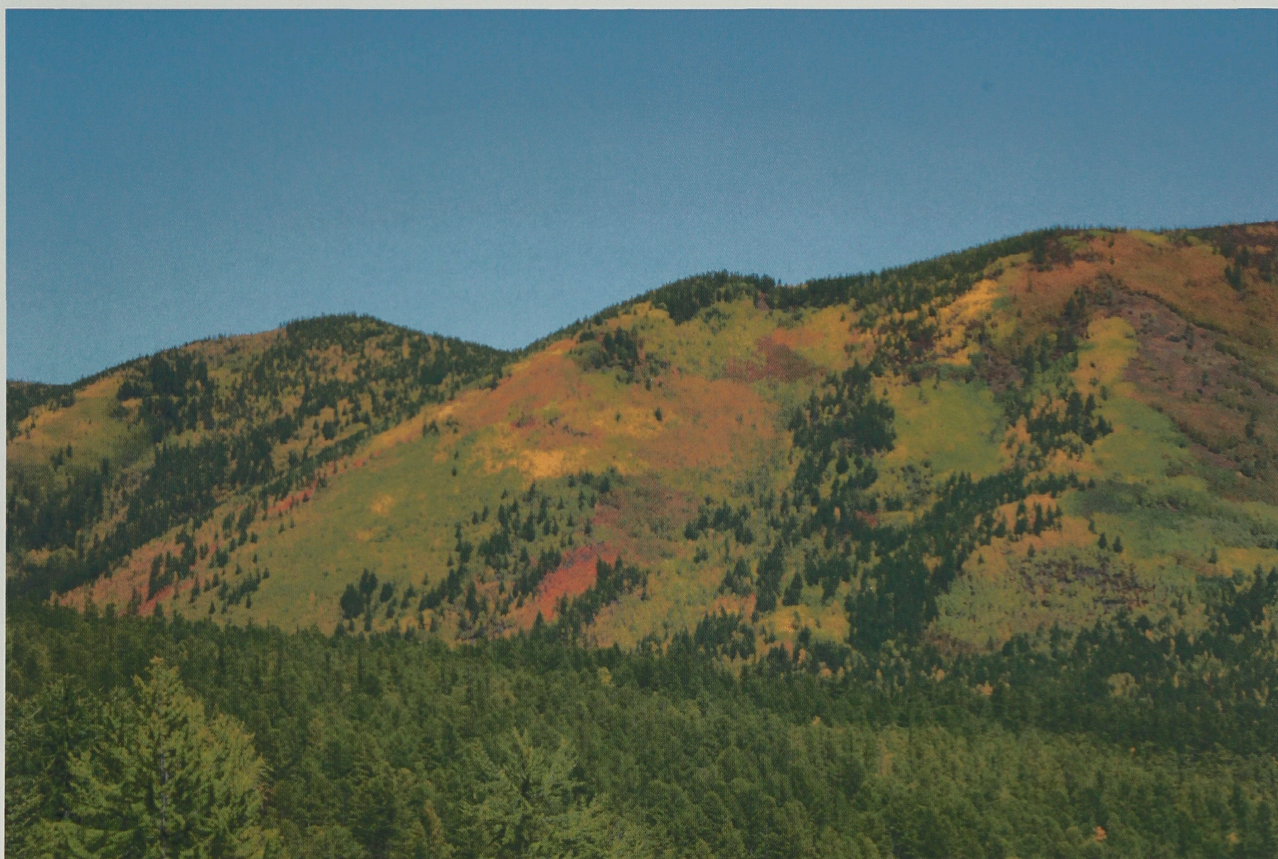
Краски осени. Окрестности ручья Гулинга