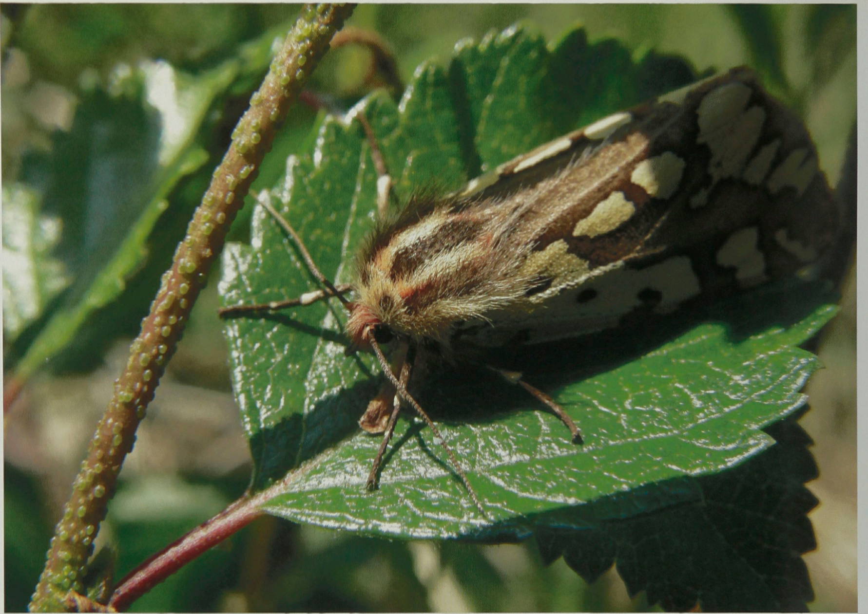
Для мотылька листочек — дом