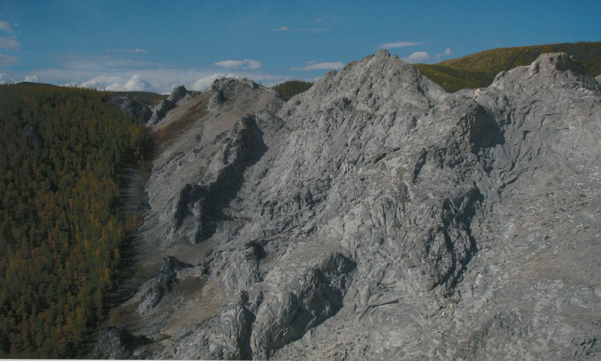
Белая гора недалеко от п. Северный (местное название «Северная белая гора»). Местность ручей Березовый.