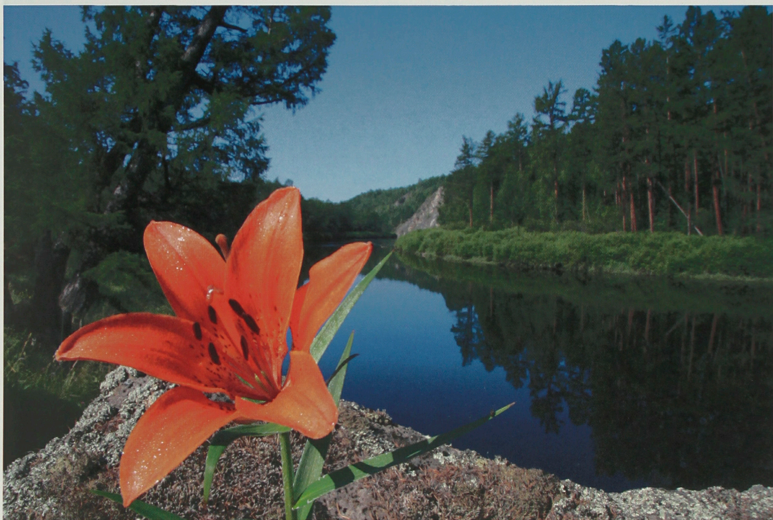
Летний день. Река большой Амалат