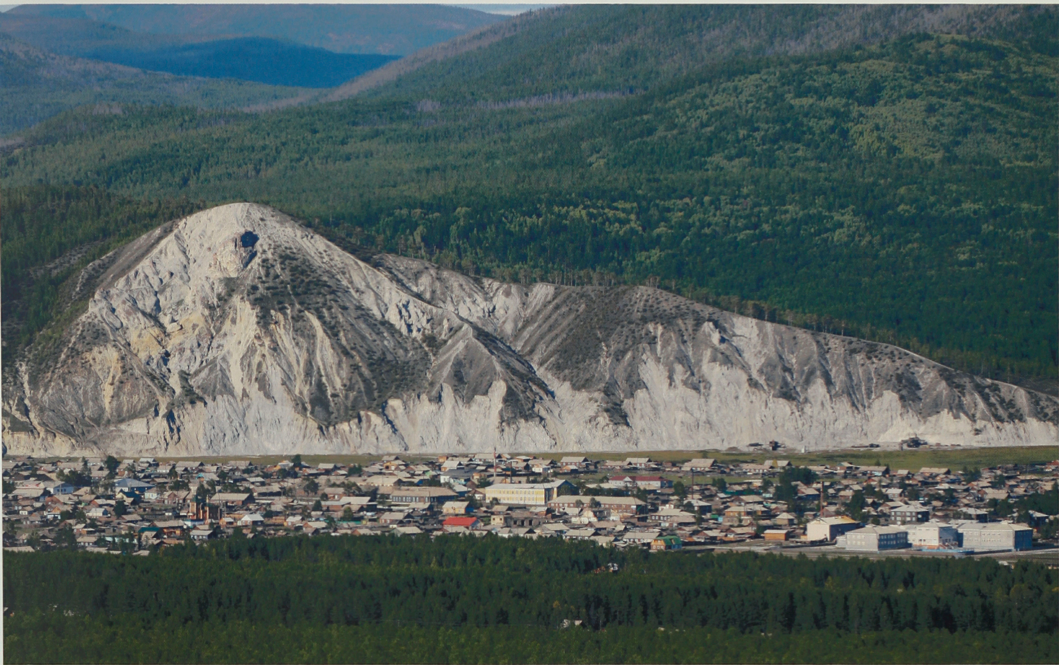
с. Багдарин у подножия Белой горы