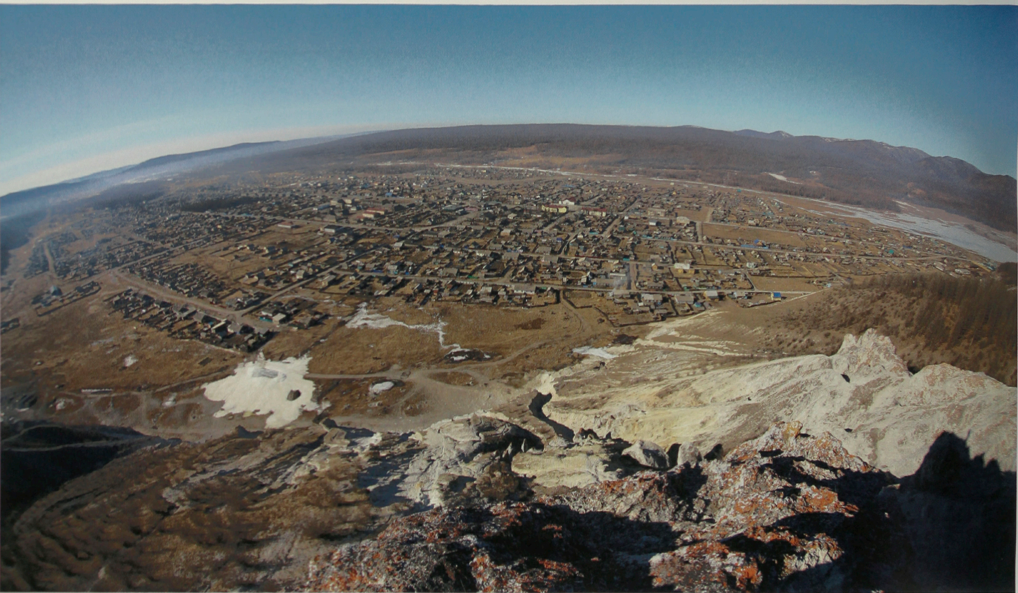
Вид на с. Багдарин с вершины Белой горы