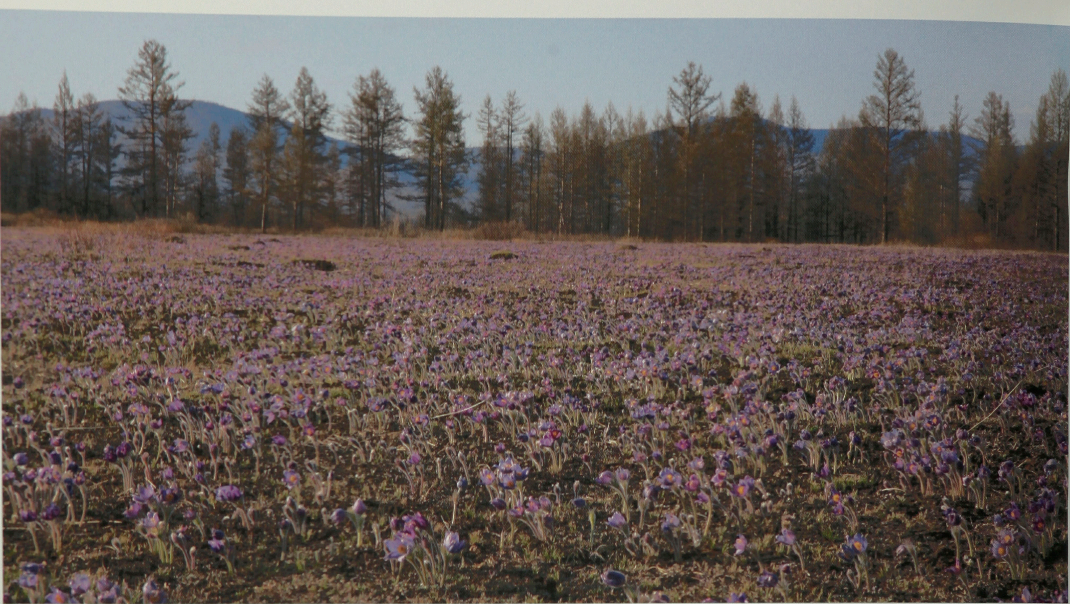
Подснежники в цвету