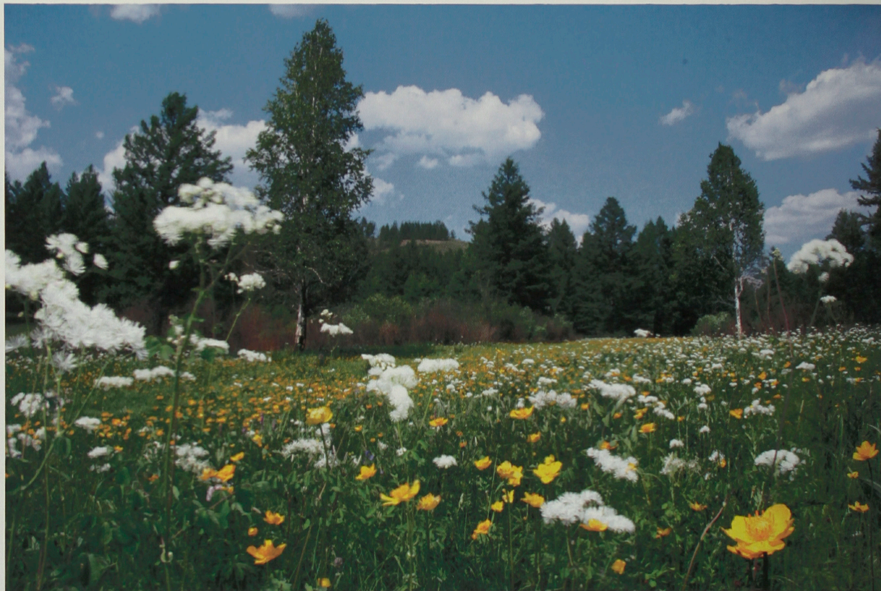
Цветущий луг. Местность Байсы