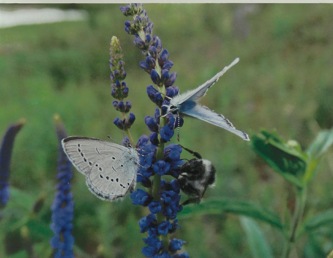
Нектара хватит всем