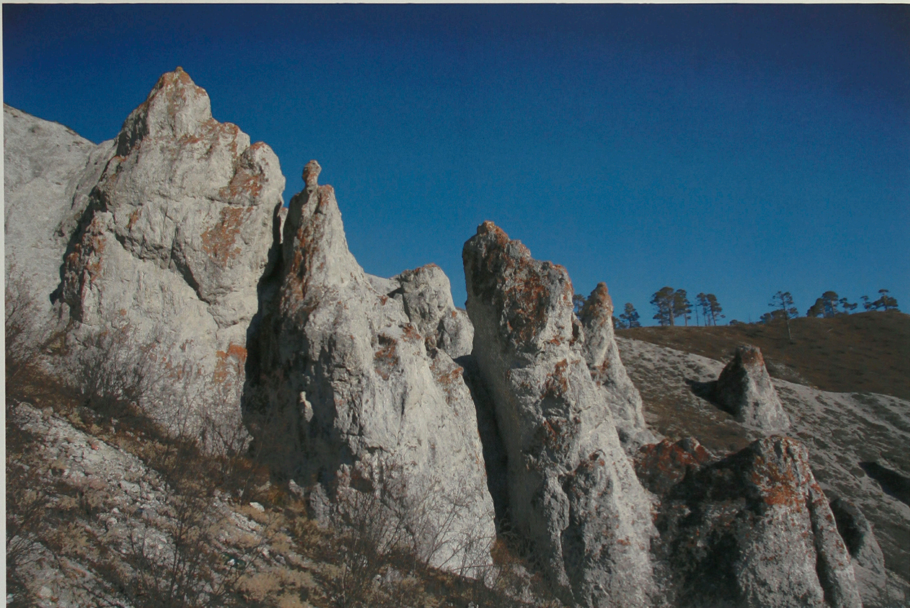
Скалы на Белой горе