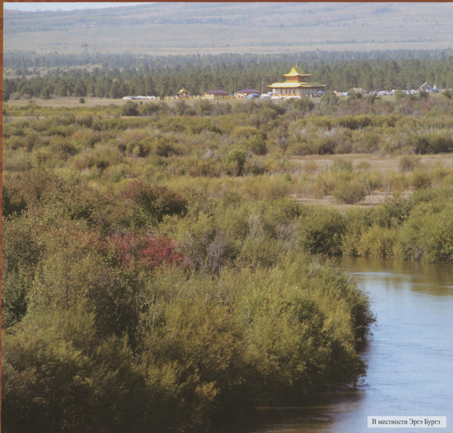
В местности Эргэ Бургэ