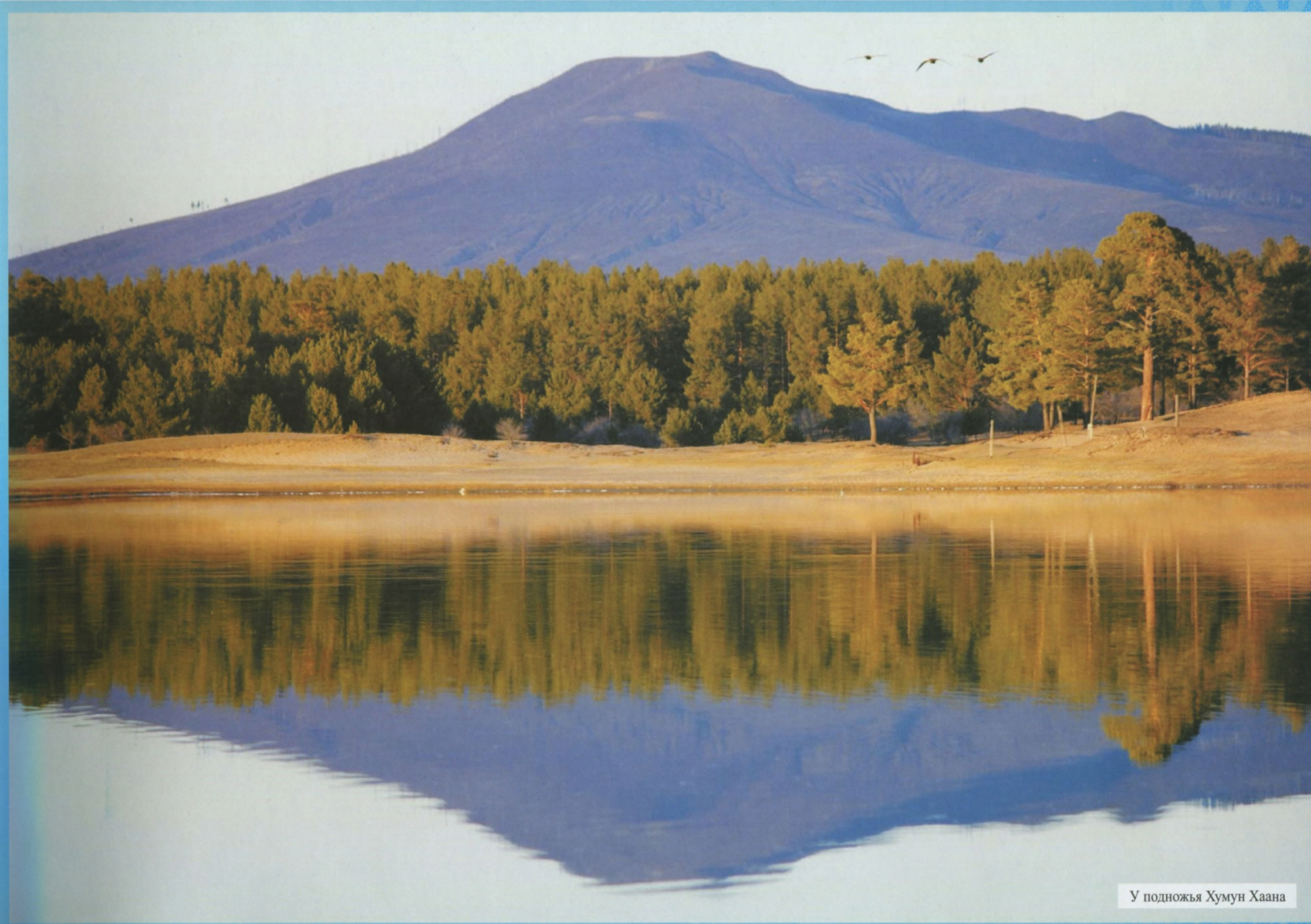
У подножья Хумун Хаана