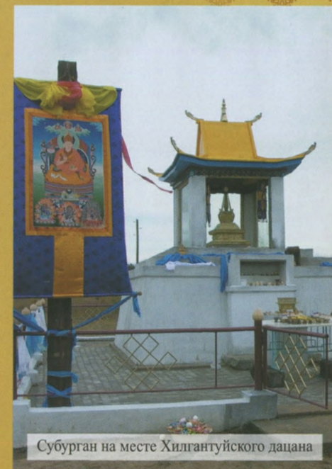
Субурган на месте Хилгантуйского дацана