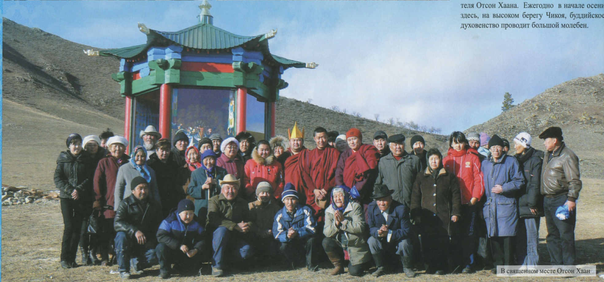
В священном месте Отсон Хаан