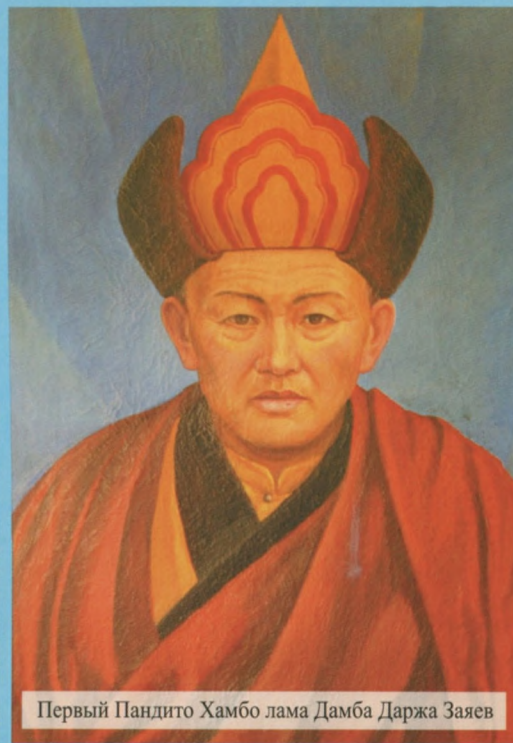
Первый Пандито Хамбо лама Дамба Даржа Заяев