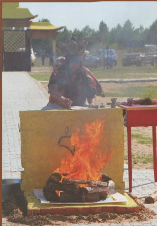
Осенью 2013 года в местности Эргэ Бургэ вновь зазвучали мантры. Здесь состоялось освящение единственного в России Дворца Бодхисатвы Манжушри. Храм возведен при поддержке Президента России В.В. Путина и верующих Бурятии.