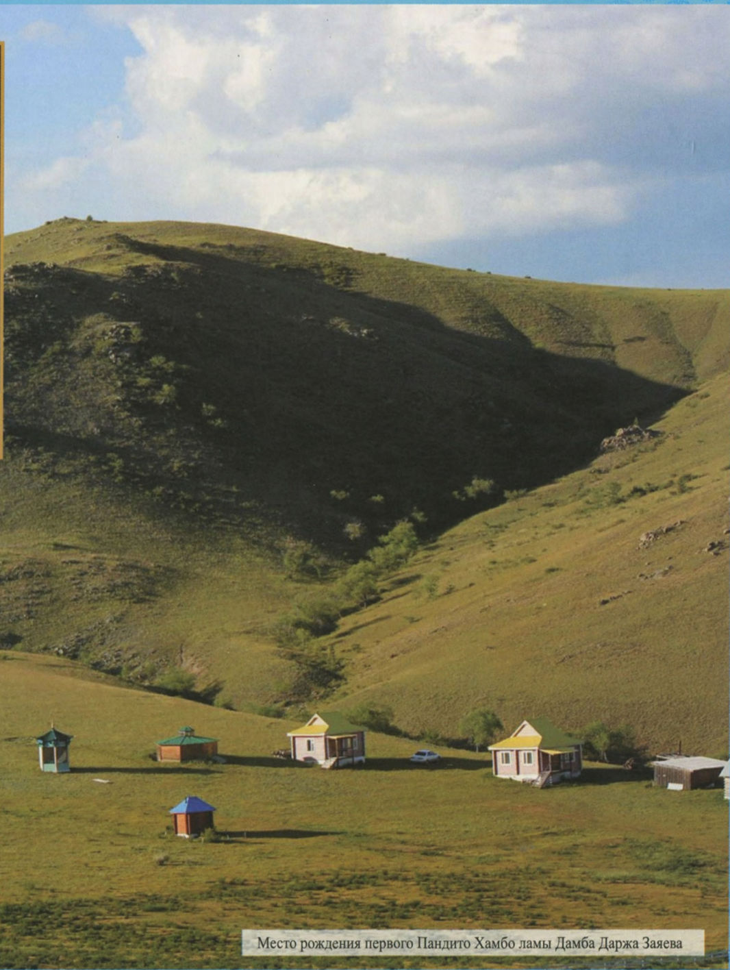
Место рождения первого Пандито Хамбо ламы Дамба Даржа Заяева