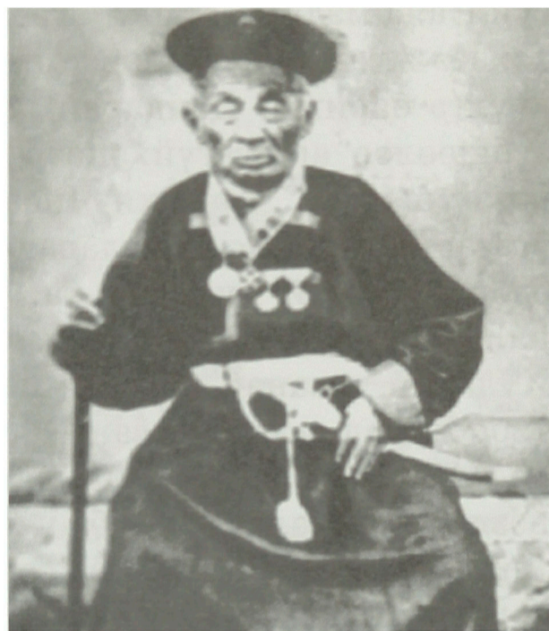
Тобын Түгэлдэр тайшаа

хэбтэшэ. Энэнь эндэхи нэгэ баянай малай бэлшээри дээрэ олдобо ха юм. Тэрээнһээ хойшо ойро зуурын арбаад жэл соо ородууд түргөөр олошороод, Нэршүүгэй приискнүүд, Нэршүүгэй заводууд бии болошобо. Тэрэ приискынхид дуулгабаряар, Мүнгэшэ хада эндэһээ ехэшье холо бэшэ, баруун хойто зүгтэ гэжэ дуулаад, үнөөхи нэтэрүү ородууд Үрөөнэйн Мүнгэшые оложорхибо ха. Эндээ дары прииск байгуулжа, Мүнгэшые малтажа эхилбэ. Гэр бүлэгүй, гэргэ хүүгэдгүй, олонхинь хаатаргаһаа табигдаһан хаатаршануудай бэлиг шэлиггүйень хэлэхын аргагүй. Буряадуудай адуу малыень хулуужа алаад эдижэрхихэ, үшөө эхэнэртэ һанаар-хаха. Иигэжэл яшаагүй дарамта хүршэнэр буряад нютагта байрлашаба. Улад зон Заарин бөөнэртөө хандажа, зайлуулыт энэ аюулые гэжэ гуйхадань, тэдэ Мүнгэшэдэ сугларжа, ехэ тайлга-гуйлга эзэн тэнгэрийн урда хэһэн гэлэй. Хойто хабарынь энээнһээ юм гү, али хүрэхэһөөл хүрөө гү, приискын ородууд шуһаар шэшээд, олонхинь үхэжэ талииба. Үсөөхэн үлэһэниинь тэрьедэжэ ошоһон аад, уданшьегүй эрьедэ дахинаа бусаад байһан үедэнь Дандарай ламхай морилжо, буряадууд обоогоо ламаар тахюулаад, ородуудые эндэһээн дайгануулыт гэжэ гуйһан ха. Мүнгэшын тайлга ламаар тахигдажа, обоо болобо. Тэрэ тахилгаһаа хойшо мүнгэниинь олдохоео болишобо ха. Хии газар хэды май малтахаб. Орхижо ошолгон дээрээ ородуудынь: