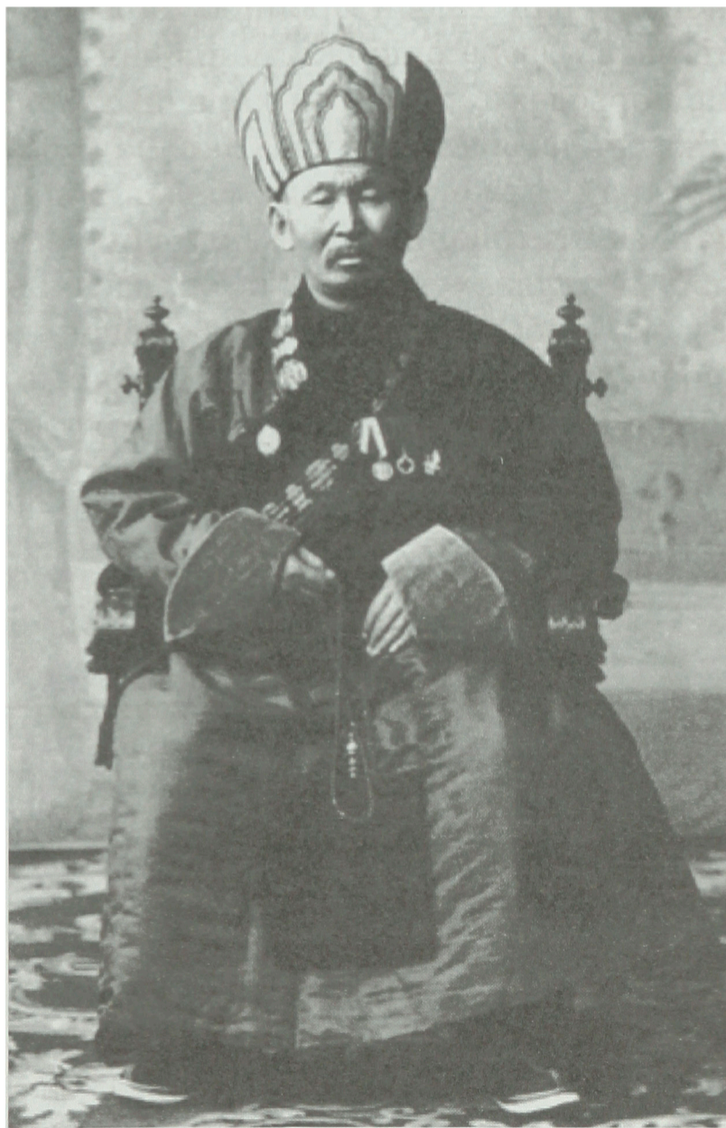
Сүүгэлэй дасанда 4 жэлдэ һураһан Этигэлэй Хамба

Зүүн ба Баруун Сүүгэлэй уулзадха дээрэ, Онон мурэнэй хойто эрьедэ оршодог Булгата гэжэ хадын үбэрөөр буурагша гүү унаһан танигдаагүй нэгэ эхэнэр үзэгдэдэг болобо ха. Тэрэ һамганай шулуугаар газар сохижо һуухыень малда ябаһан хүн хараад гайхаһандаа: «Энэ юу хэжэ байна гээшэбта?» – гэхэдэнь, – «Эндэхи газарые нягта болгожо, дасанай һуури бэлдэнэб», – гэжэ харюусаа. Хожомынь эндэ үбгэн хүгшэн хоёр һэеы гэрээ баряад байрлаба ха. Нэгэтэ тэдээнэй сэргэдэнь буурал моритой, набтархан бээтэй, ташуур бариһан эхэнэр бууба. Гэртэ ороходонь, аарса халаагаад уужа һууһан гэрэй эзэн эхэнэр айлшандаа аягалба. Тэрэнь ехэтэ аяшаажа уугаад: «Яһан амтатай аарса ууба гээшэбиб», – гэжэ баяраа мэдүүлээд гарахадань, гэрэй эзэн эхэнэрэй хойноһоонь гаралсаад харахадань, унаань морин бэшэ, гүүн байба. «Һайн байгты!» – гээд, Булгата руу хараад хатаршаба. Хадын шанха орой шэглээд юугээ бэдэржэ ошобо гээшэб гэжэ гайхаһандаа, хойноһоонь хара хараһаар байтарынь, үгсүүр болохо бүринь гүйдэлынь бүри түргэдөөд, Булгатын оройгоор дэгдэшэбэ ха.