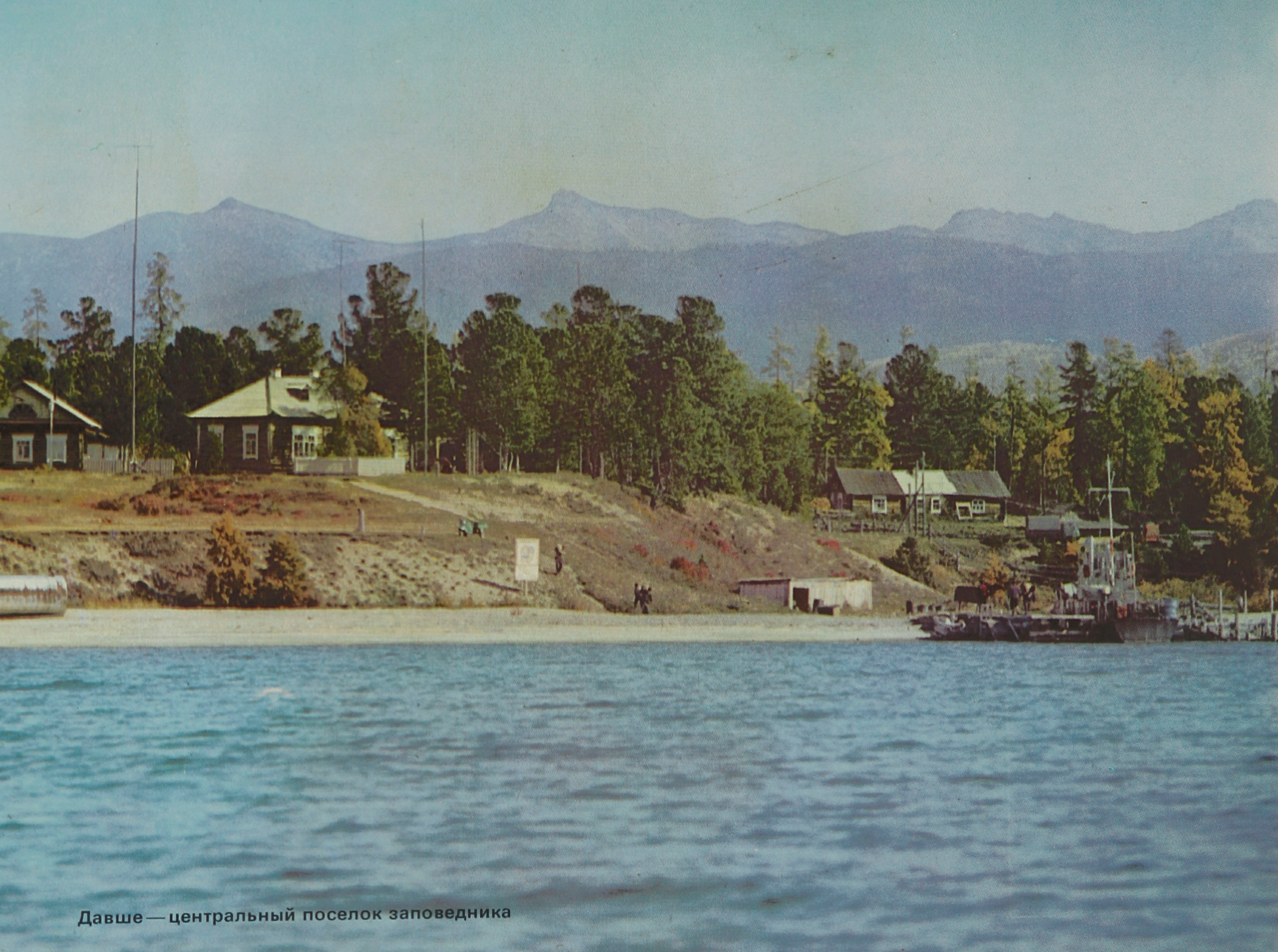
Давше — центральный поселок заповедника