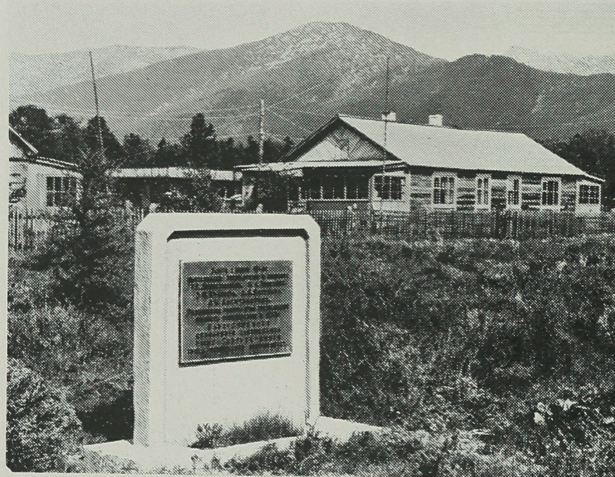
Мемориальная доска на месте высадки экспедиции Г. Дюпелямаира