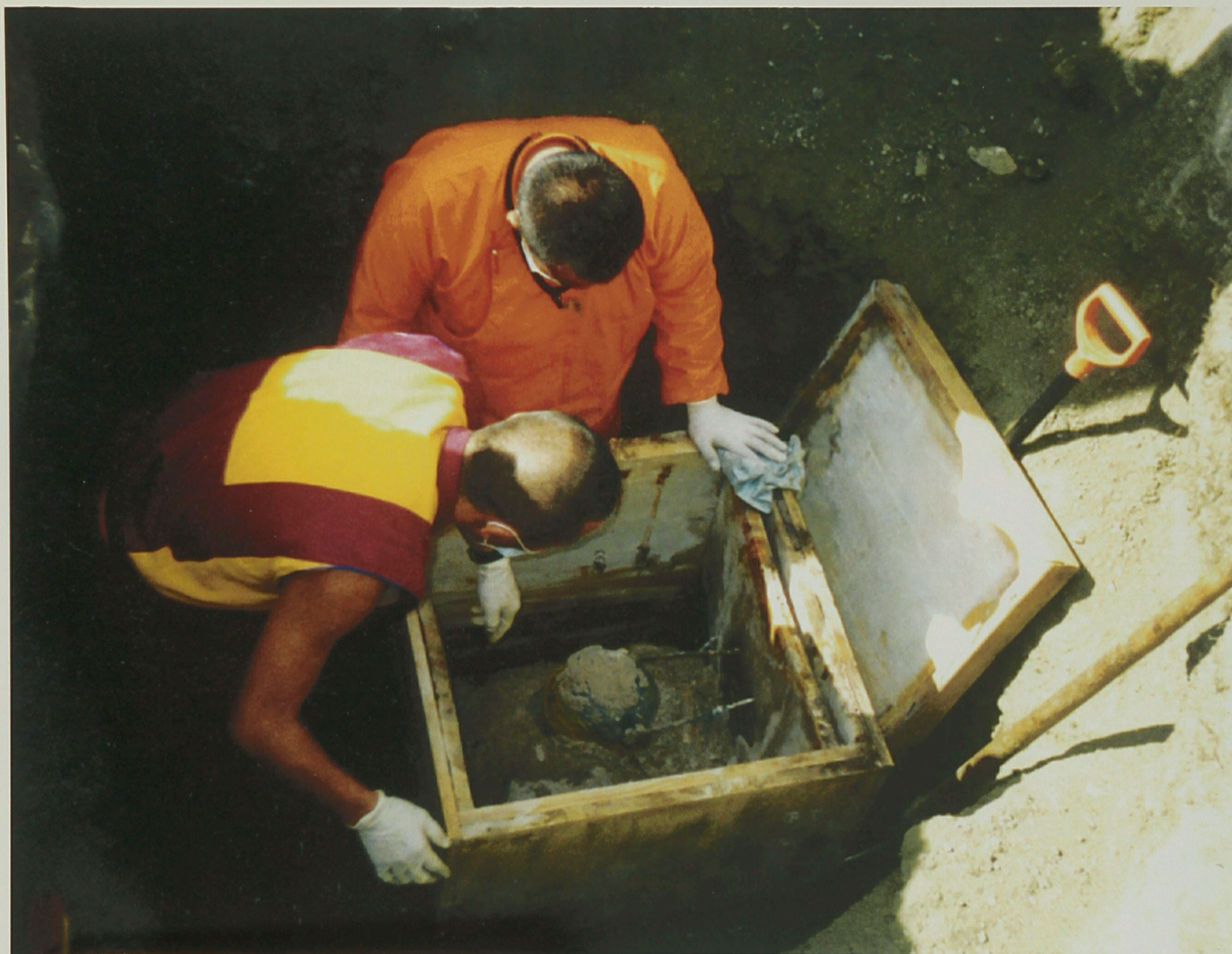
Эндэ байһан Этигэл Хамбын олгожо байһан үе.