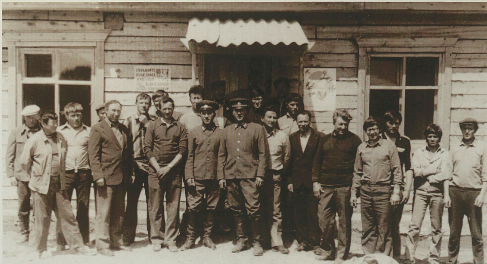
Совещание егерьской службы заказников Охотуправления Республики Бурятия. Алтачейский заказник

уголка природы, чтобы исключить влияние человека на этот уголок и оставить его в девственной прелести». Д.К. Соловьев понимал под заказниками ведение строгого заповедного режима, но лишь на определенный срок. Именно с этого времени заказники можно называть младшими братьями заповедников.