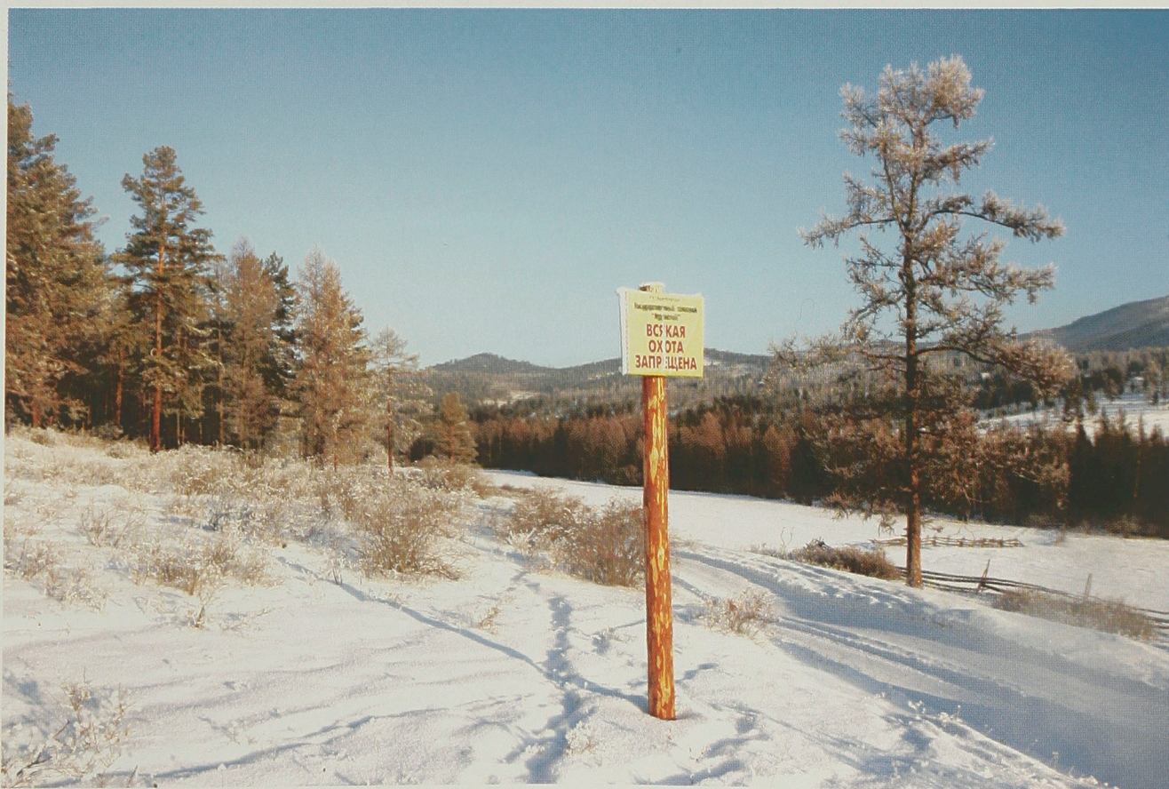
Предупредительный аншлаг на границе заказника

В ходе реформы органов государственной власти в 2004-2005 гг. заказники регионального значения переданы в ведение Министерства природных ресурсов и охраны окружающей среды Республики Бурятия (Минприроды РБ). В настоящее время функции дирекции, охрану, воспроизводство, регулирование и учет численности объектов животного мира на территории заказников регионального значения осуществляет созданное на основе Постановления Правительства Республики Бурятия от 15 июля 2005 г. №231 государственное учреждение «Природопользование и охрана окружающей среды Республики Бурятия» (ГУ «Бурприрода»), входящее в структуру Минприроды РБ.